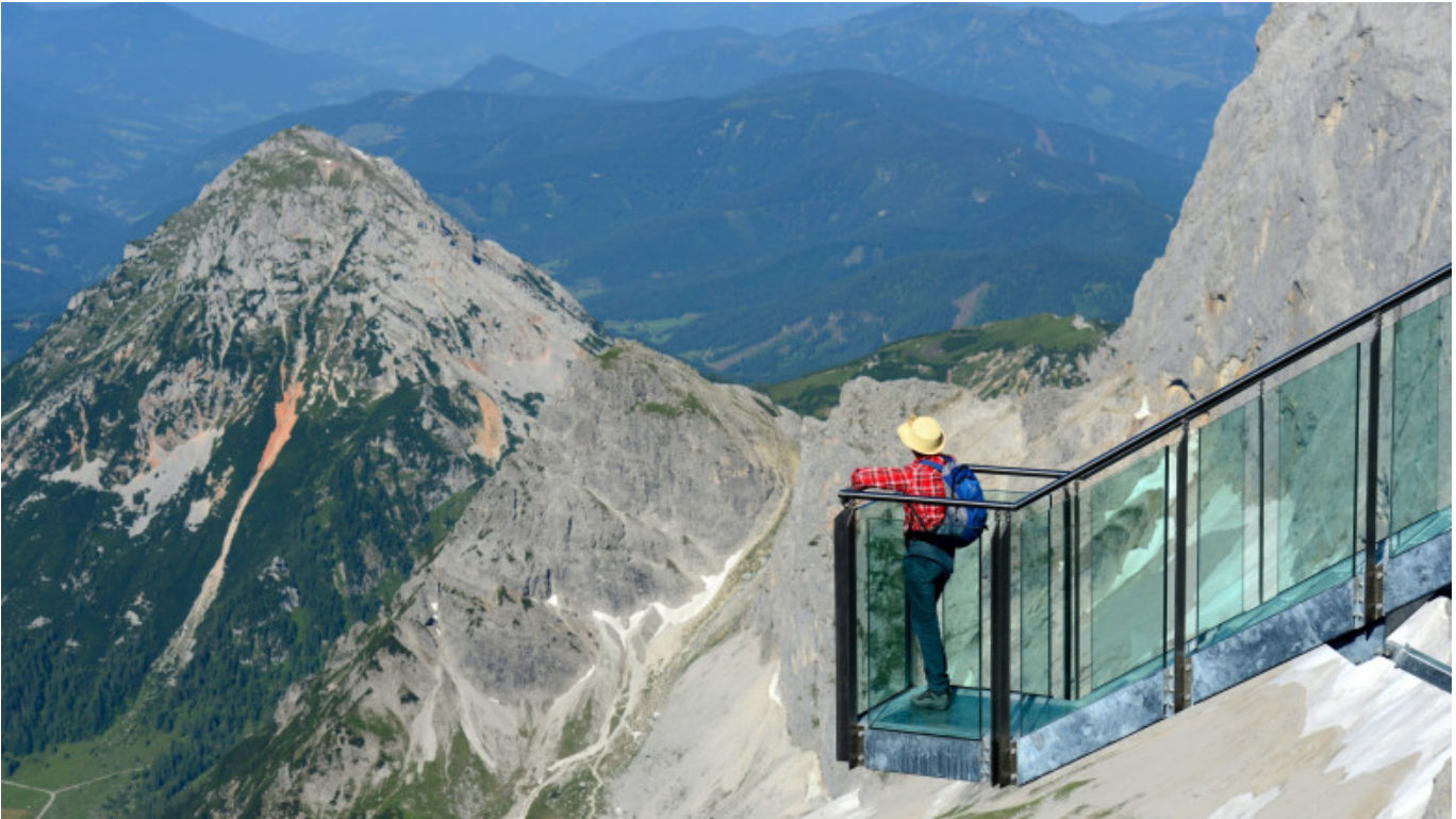
© Der Dachstein - Gery Wolf